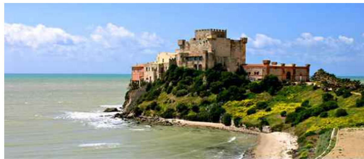
Piano di Utilizzo del Demanio Marittimo (P.U.D.M.)

REGIONE SICILIANA COMUNE DI BUTERA LIBERO CONSORZIO COMUNALE DI CALTANISSETTA