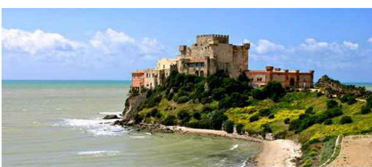
Piano di Utilizzo del Demanio Marittimo (P.U.D.M.)

REGIONE SICILIANA COMUNE DI BUTERA LIBERO CONSORZIO COMUNALE DI CALTANISSETTA